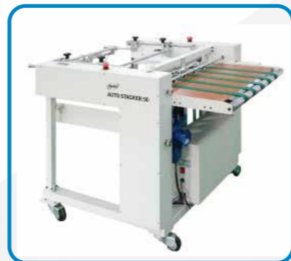
全自動排紙スタッカー ST-50 最大用紙サイズ 540mm x 750mm 最大積載量 500mm W830mm x L1190mm x H950mm 電源 単相 200V~220V 50/60Hz