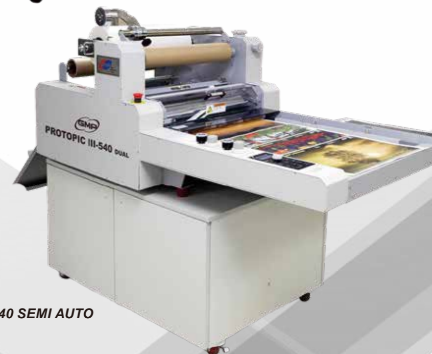
PROTOPIC540 SEMI AUTO