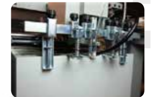
センターストリーム フィーダー