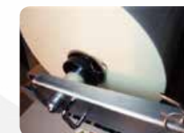
カンチレバー式 フィルムシャフト