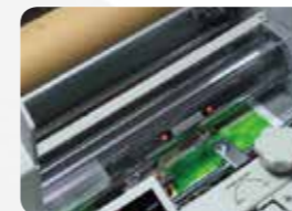
クロムメッキ ヒートローラー