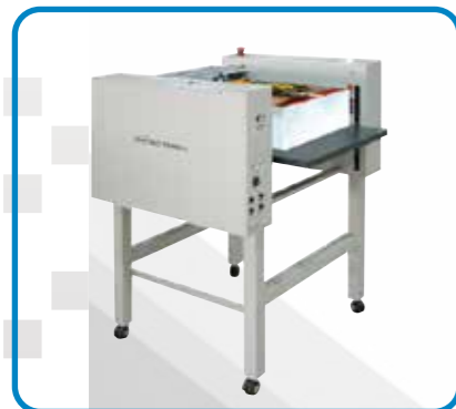
ベルト フィーダー 35 PROTOPIC SEMI AUTO用 オプション給紙装置