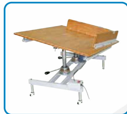
ジョガー式スタッカー JT700 最大用紙サイズ 700mmx700mm 最大積載量 100mm W795mm x L820mm x H410~545mm 電源 単相 200V~220V 50/60Hz