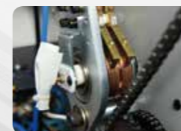
高感度温度センサー