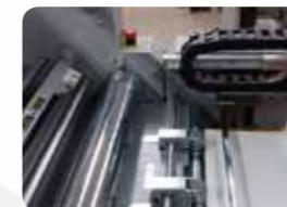
全自動オーバー ラップシステム