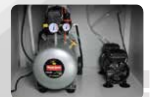
内蔵型コンプレッサーと バキュームポンプ