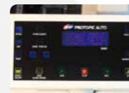
対話式タッチパネル