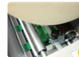
インライン ミシン刃装備