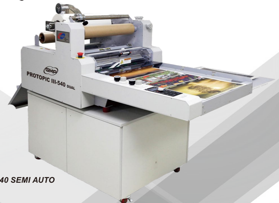
PROTOPIC540 SEMI AUTO