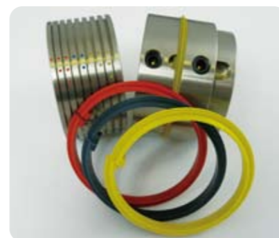
カラーコード化されたスジ押し刃